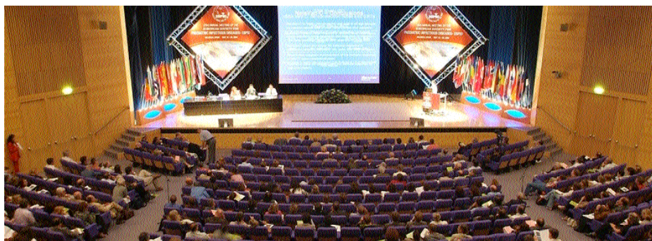
Auditorio del Palacio de Congresos de Valencia.